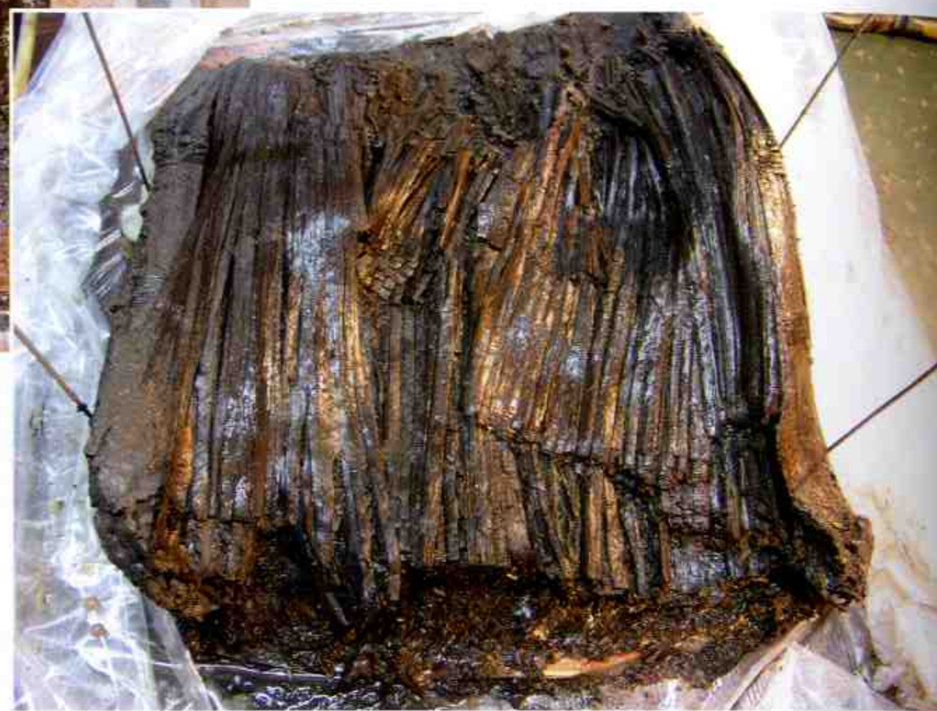
竹筒揭盖后简牍表层情况 Surface Layer of Slips and Tablets in Uncovered Bamboo Box

盖板横向平铺，有一定程度的腐烂和下塌变形。墙板和挡板以厚木板侧叠拼成，有向内侧弧曲、倾塌等变形的情况。隔梁和隔板将椁室分隔为西棺室和东边箱，椁室内空长约2.07、棺室宽约0.76、边箱宽约0.44米。木棺外形长1.96、宽0.58、高0.58米，由底板、墙板、挡板、盖板构成，为平底方棺，长方盒形，素面无漆。棺底东头有头骨痕迹及人牙，据此判断头向朝东；其余人骨无存，葬式不明。随葬品有陶器8件，漆、木、竹器26件，铜器1件，铅器1件，石质器1件套，其中铜镜、木梳、木篦各1件置于棺内头端，其余均放置于边箱内。3号竹筒装满简牍，呈东西向放置于边箱中、西段之际。边箱中、东段的大部分器物在打井时被扰乱，3号竹筒及其内的简牍小部分遭到破坏。