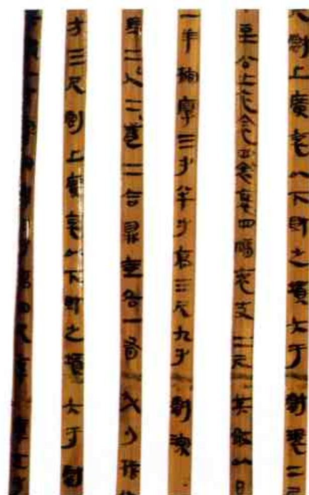
法律简 Slips with Laws