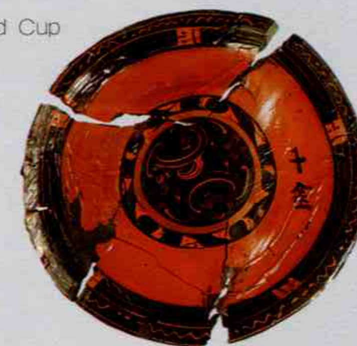
漆圆盘 Lacquered Round Dish

十分狭窄。墓坑不能完全揭露，但已将椁室全部清理，椁室内清理出的淤泥也全部经过淘洗。墓葬编号为睡虎地 M77，出土随葬器物 37 件，特别重要的是出土了一批内容丰富的西汉简牍。