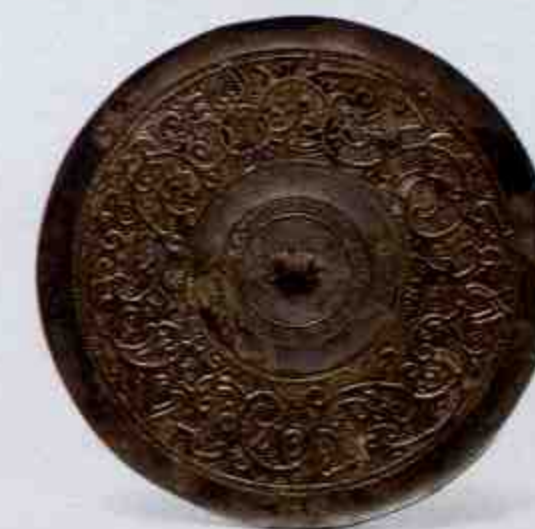
铜镜 Bronze Mirror