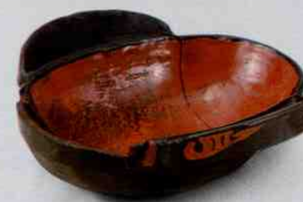
漆耳杯 Lacquered Eared Cup