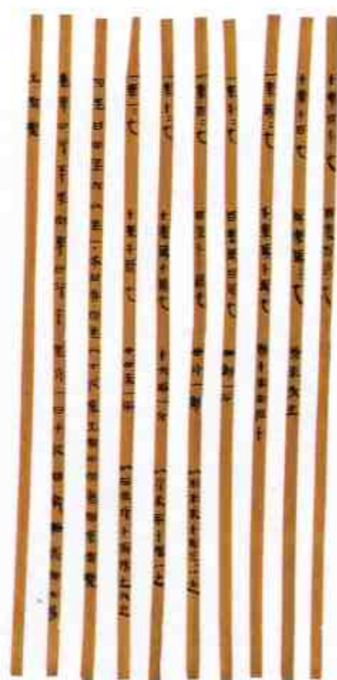
算术简 Mathematic Slips