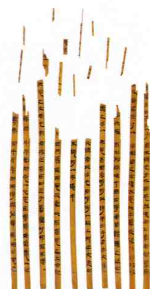
书籍简 Slips with Readings