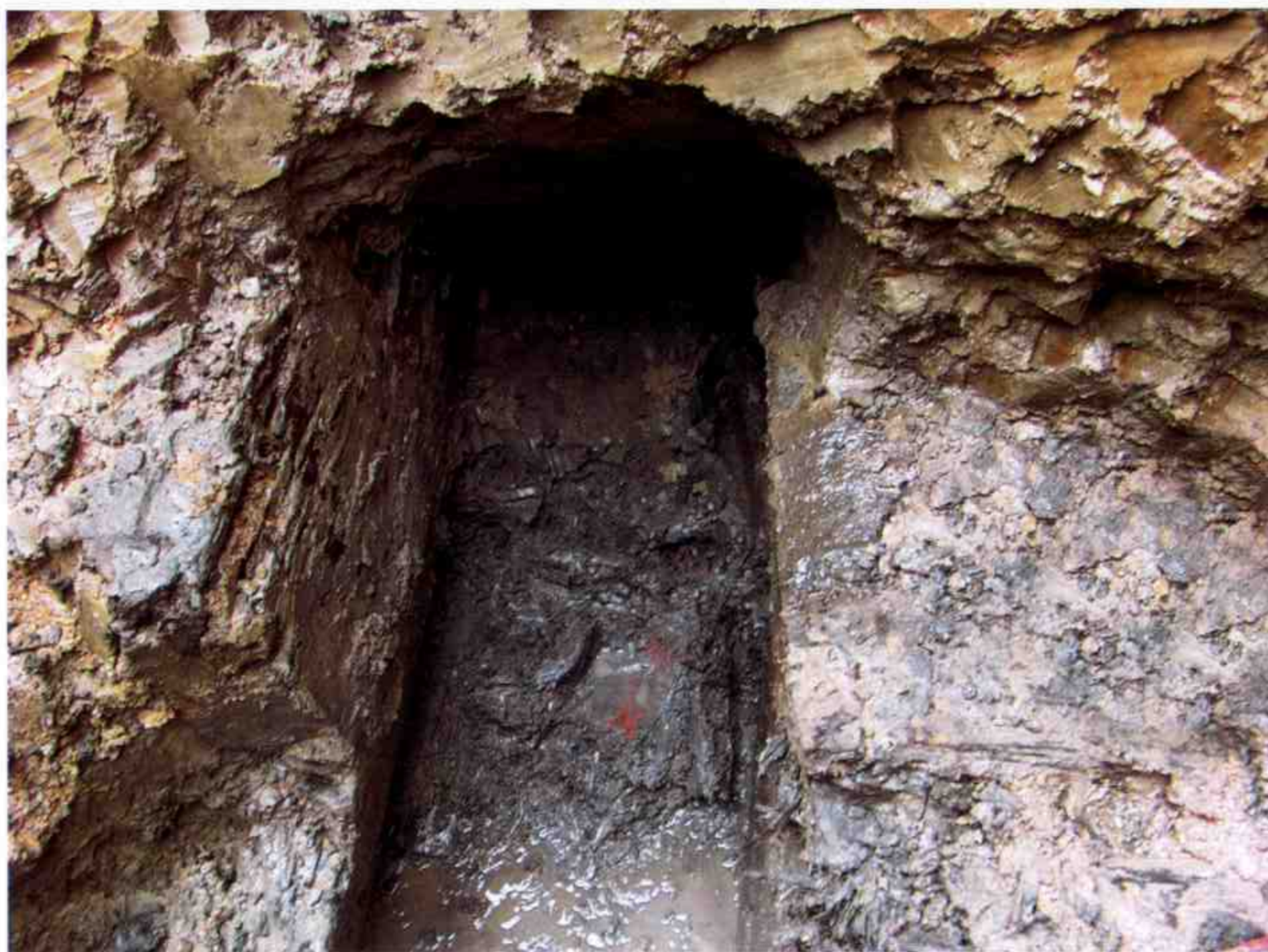
漆木器及简牍出土情况 Lacquered wood-ware and Inscribed Slips and Tablets in Excavation

铁路路基，在云梦火车站北面铁路三孔涵洞东端北侧有砌石封护的铁路护坡上打一口直径约1米的竖井建防护桩，下掘至约5米深时挖到一座古墓葬。井打在墓的东南部，椁盖板被打穿，边箱中、东段被扰乱。湖北省文物考古研究所和云梦县博物馆立即对这座墓葬进行了抢救性发掘。该墓葬所处局部环境异常特殊，墓坑整体位于铁路石砌护坡之内，西端已进入铁路路面下方，北、南两侧分别抵近建筑物和涵洞口路面，可以实施有效开挖的发掘区间