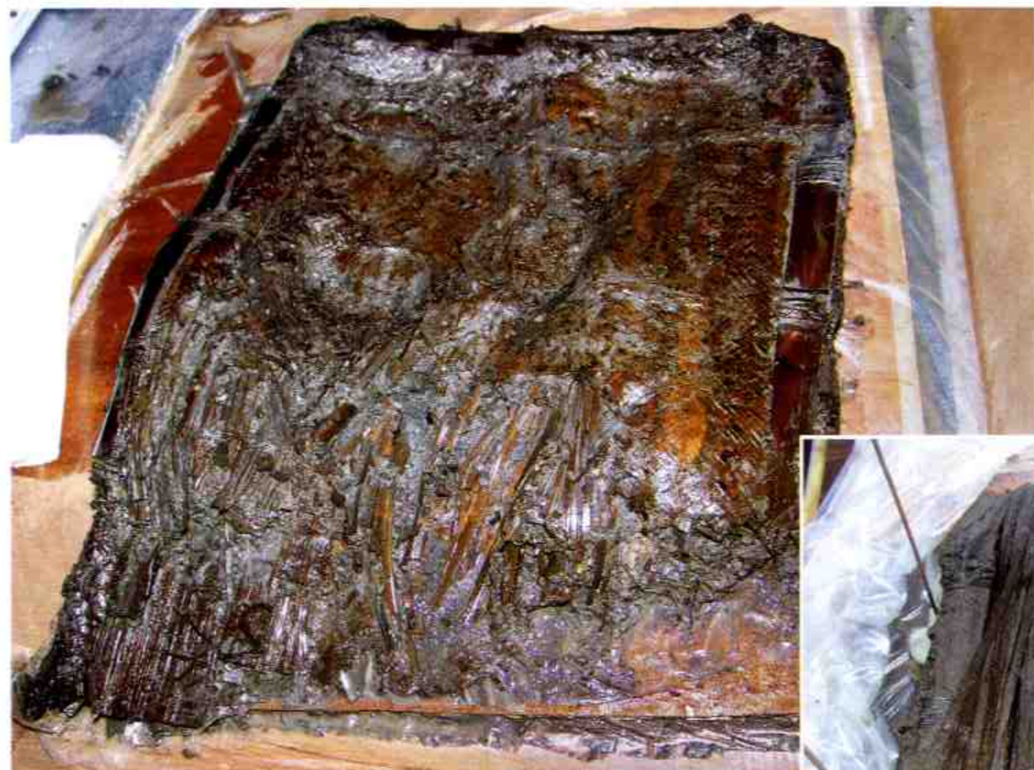
竹筒揭盖前情况 Covered Bamboo Box