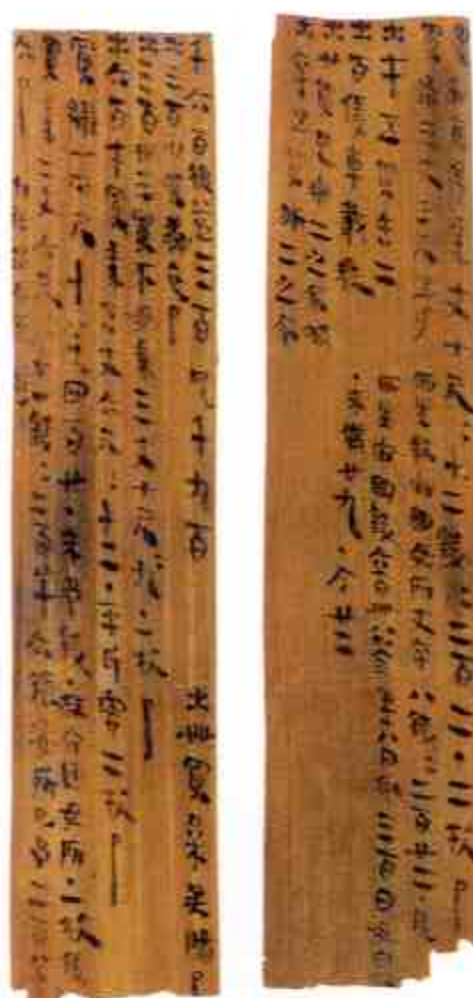
木牍 Wooden Tablets