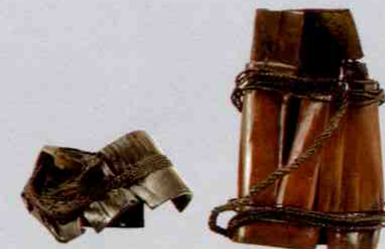
竹筒 Bamboo Pots