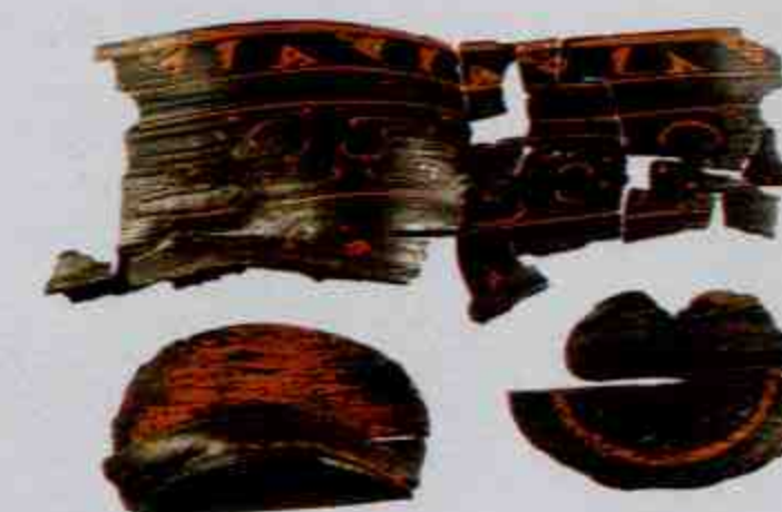
漆卮 Lacquered Zhi Wine Vessels