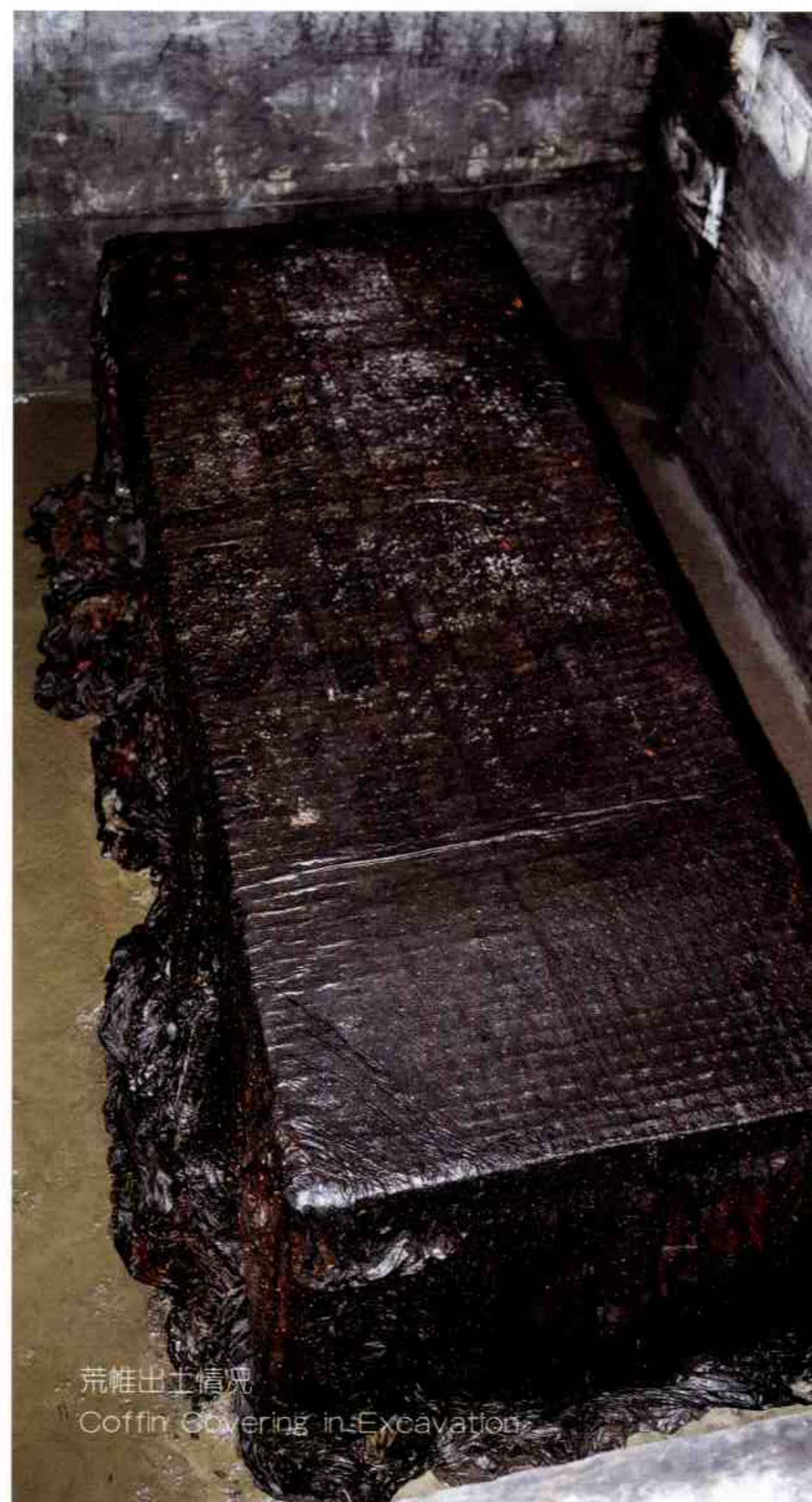
荒帷出土情况 Coffin Covering in Excavation

棺为单棺，呈长方盒状，内外均髹黑漆，保存完好，密封严实。棺全长2.48、宽0.88、高0.83