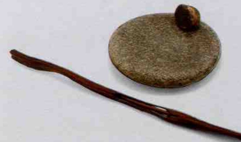
毛笔、笔套、石砚、研墨石 Writing Brush, its Cap, Ink-slab and Ink-grinding Stone