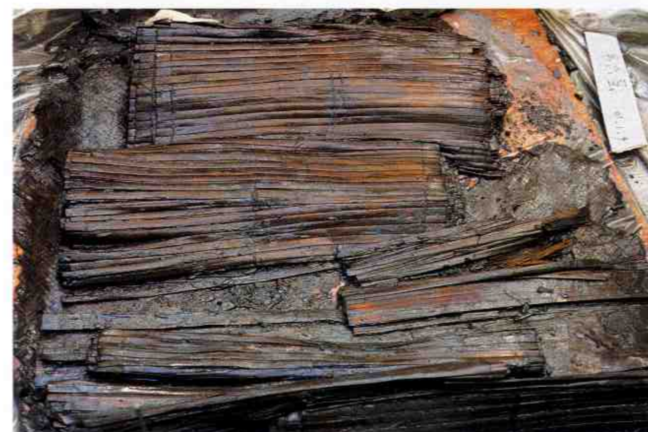
简牍下层情况 Lower layers of Slips and Tablets