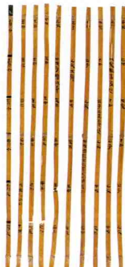
质日简 Almanac Slips

The Shuihudi Cemetery lies at Shuihu Road in the west of the seat of Yunmeng County, Hubei Province. In November 2006, a building team of Wuhan — Danjiangkou Railway discovered there an ancient tomb in a construction course. Soon the Hubei Provincial Institute of Cultural Relics and Archaeology and the Yunmeng County Museum carried out a salvaging excavation to explore the tomb and numbered it Shuihudi-M77. It yielded a batch of inscribed slips and tablets, including 2,137 pieces preserved in situ. In content the slips can be classified into almanacs,