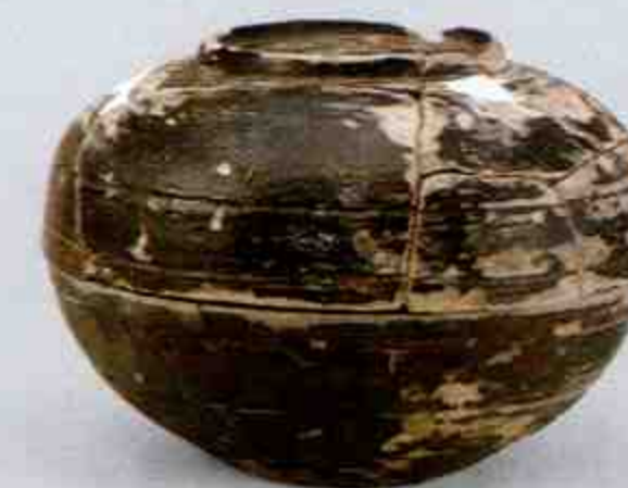
陶盒 Pottery Box